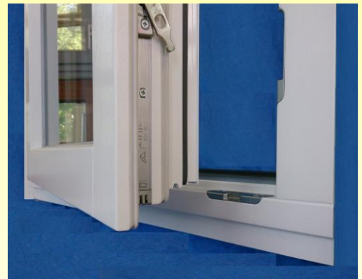
Holz-Alu-Fenster IV 80 Aluline

Östringer Fenster und Türen GmbH & Co. KG Thomas-Howie-Str. 17 76684 Östringen Tel. 07253 21478 Fax 07253 25561 info@fenster-oestringer.de www.fenster-oestringer