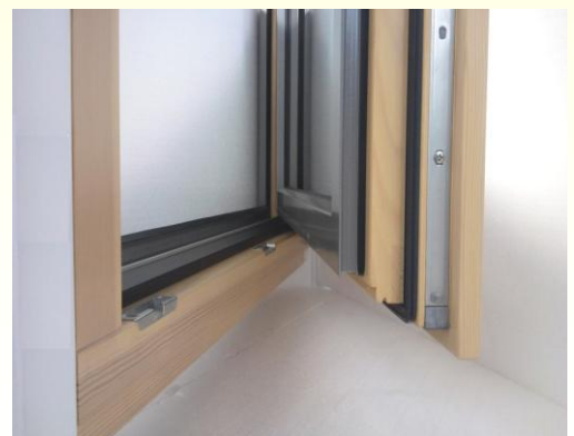
Holz-Alu-Fenster IV 68 Aluline