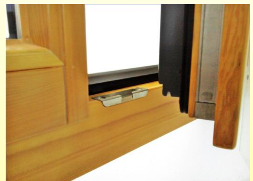
Holzfenster IV 68 2farbig