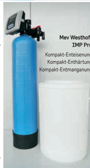
Mev Westhoff IMP Pro Kompakt-Enteisung Kompakt-Enthärtung Kompakt-Entmanganung

Westhoff IMP und IMP Pro kommen auch bei unseren Enthärtungsanlagen / Nitratentfernung und Entsäuerungsanlagen / Entfärbungsanlagen voll zur Entfaltung.