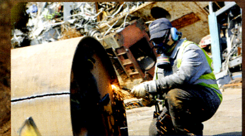
Schrott ist nur der Anfang. Wir sorgen auch für den Rest.