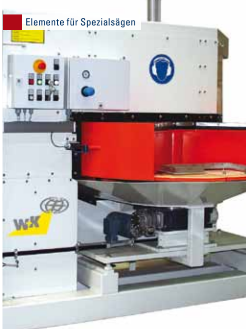
Elemente für Spezialsägen